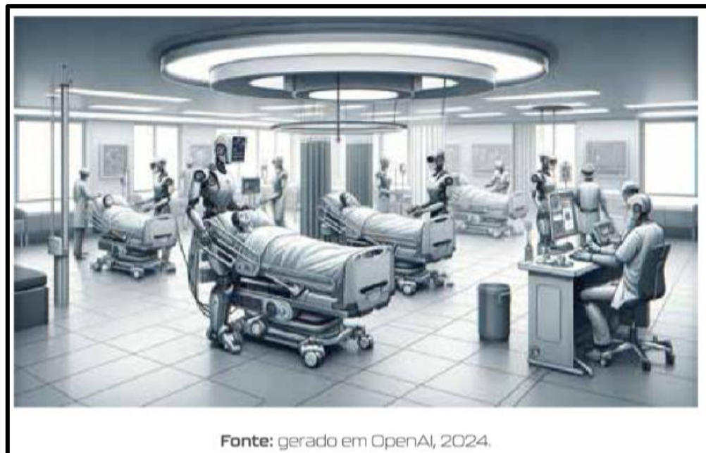
Figura 4 – IA em Hospital