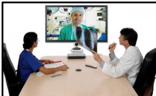
Figura 1 - Teleducação

Ateleassistência - é um serviço que oferece cuidado à distância, utilizando tecnologia de comunicação para prestar assistência e suporte a pessoas, especialmente aquelas com condições crônicas, idosos ou pacientes que requerem um acompanhamento regular. É uma assistência a distância que viabiliza o monitoramento e acompanhamento do paciente de forma remota.