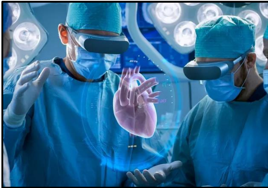
Figura 5 - Exemplo de realidade aumentada

Segundo Macedo (2022, p. 13) “A tecnologia de realidade aumentada também já permite criar sua própria versão digital em 3D, que é capaz de passear pelo ambiente real.”. A realidade virtual e aumentada na medicina, pode ser abordada suas aplicações na educação médica, cirurgia, reabilitação, entre outros tratamentos.